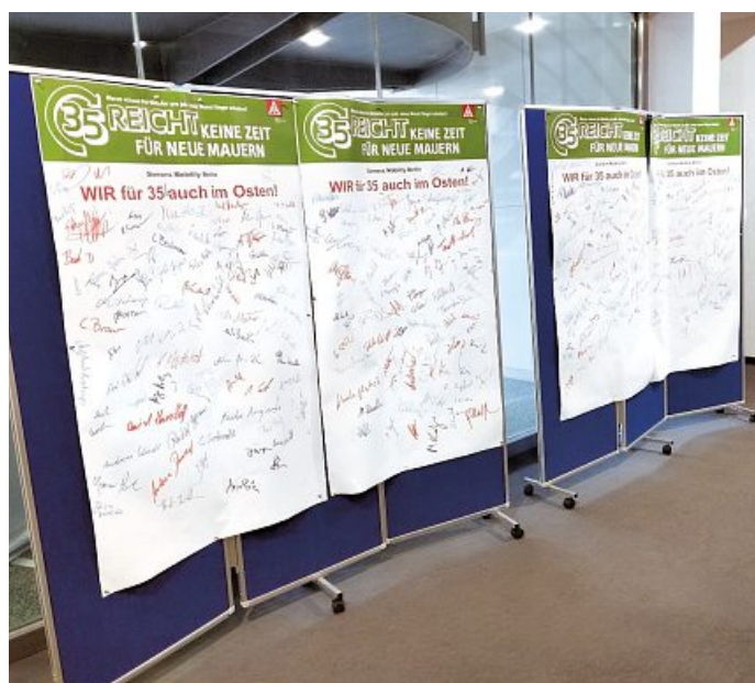
Bei einer Betriebsversammlung bei Siemens in Treptow entstanden diese Unterschriftenlisten für die Arbeitszeitverkürzung

„Endlich beginnt ein Prozess, der lange überfällig war. Offensichtlich wird den Arbeitgebern bewusst, dass sie die Problematik angehen müssen und nicht mehr vor sich herschieben können. In der Frage, dass es Sachsen wirtschaftlich sehr gut geht, stimmen wir durchaus überein. Mein Fazit: Es ist Zeit!“